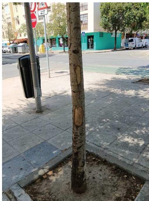
Detalle de heridas en tronco