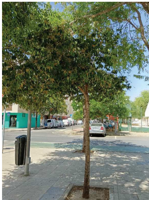
Vista general del ejemplar con id 43853