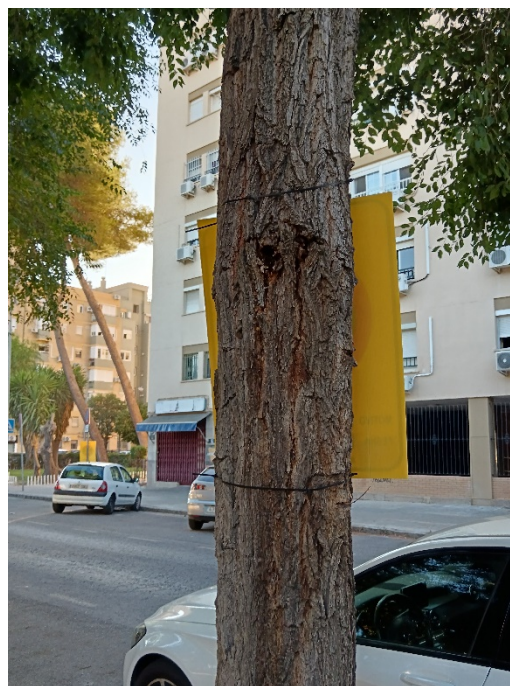
Detalle de lesiones en tronco y copa