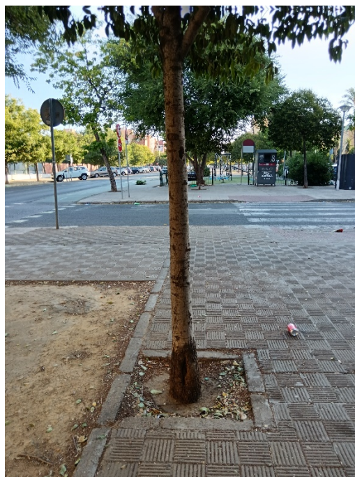
Detalle de lesiones en tronco