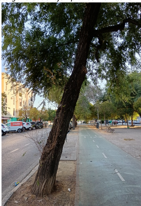
Detalle de tronco