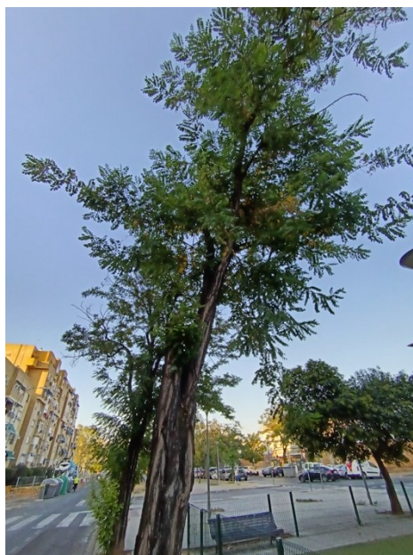
Vista general del ejemplar con id 43717, copa desestructurada