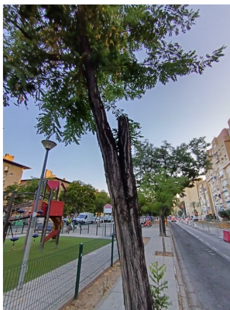
Cavidad longitudinal en tronco, grieta abierta desde la cruz. Brotaciones en base