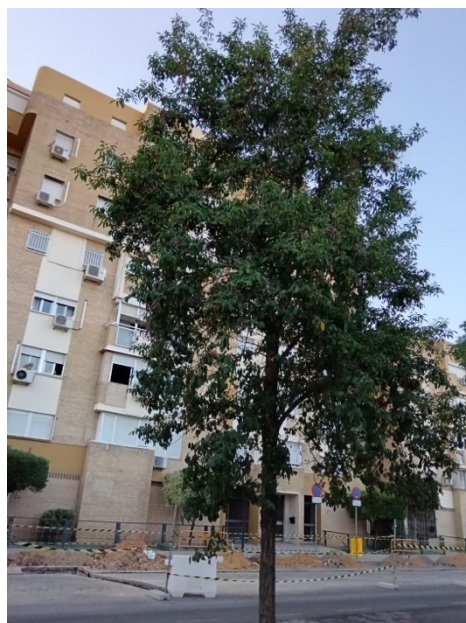
Vista general del ejemplar con id 43721