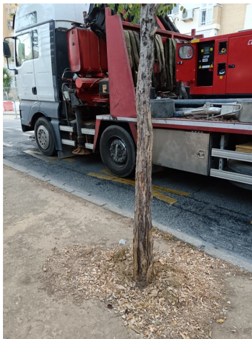
Cavidad con pudrición en cuello y base. Descortezados y heridas en tronco