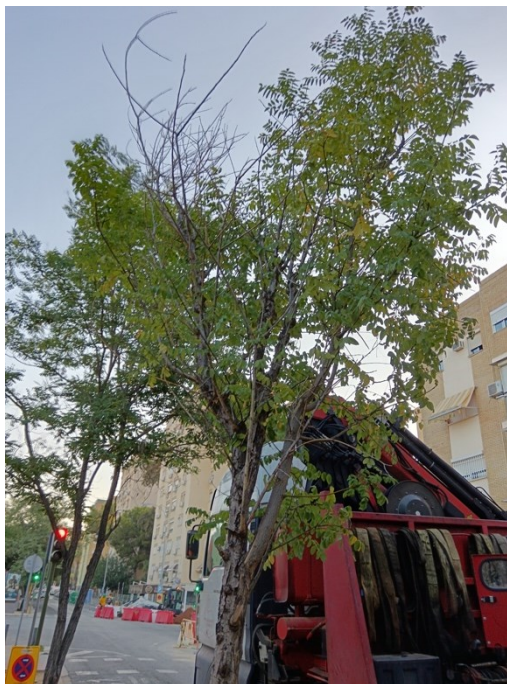
Vista general del ejemplar con id 43725. Ramas secas y heridas en copa