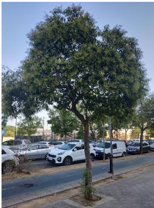
Vista general del ejemplar con id 43687