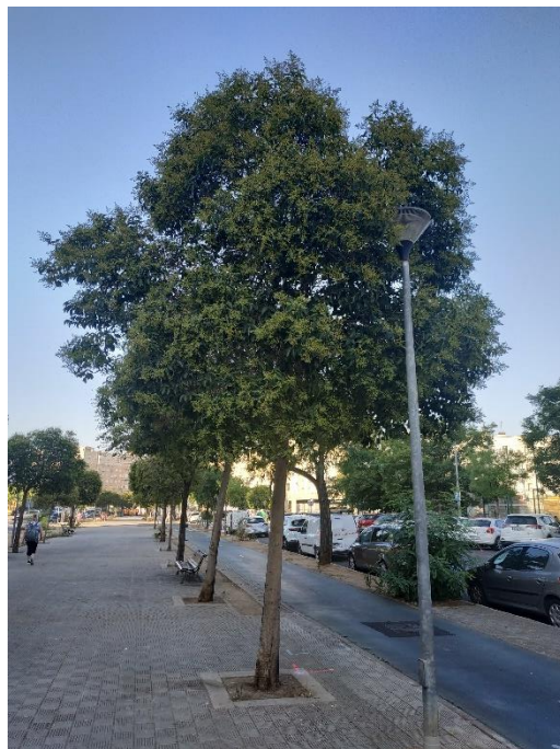
Vista general del ejemplar con id 43691