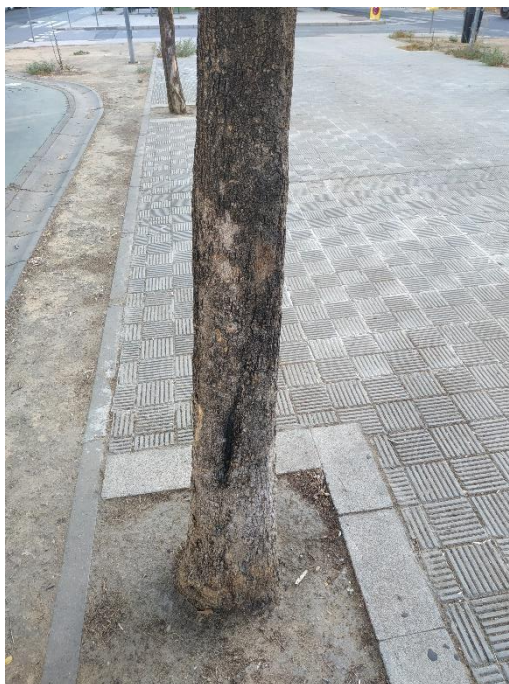
Maderas vistas en tronco del ejemplar con id 43697