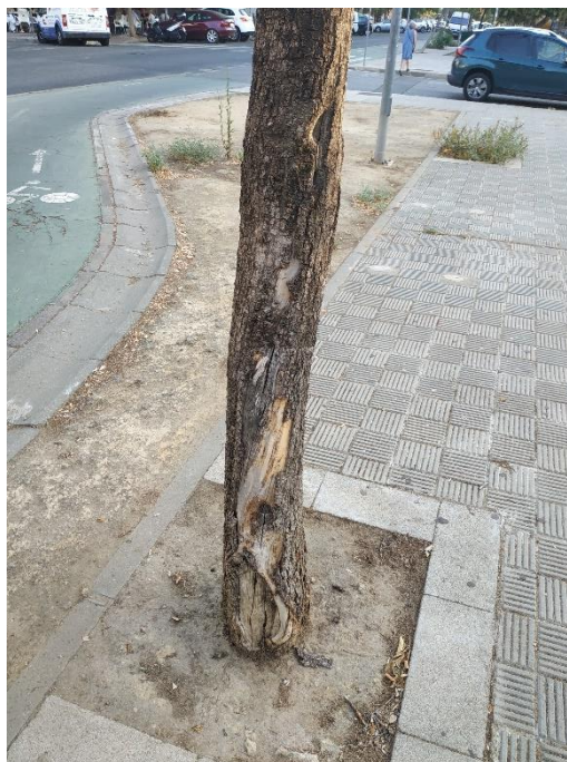
Heridas del ejemplar con id 43698