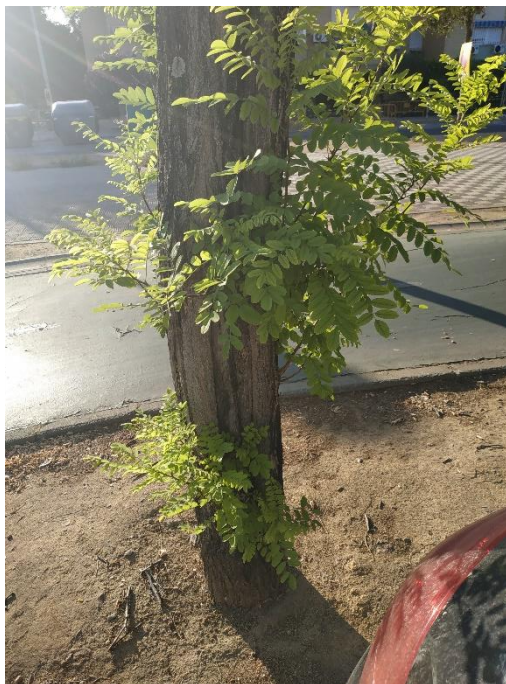
Vista general del ejemplar con id 43701. Cavidad en tronco