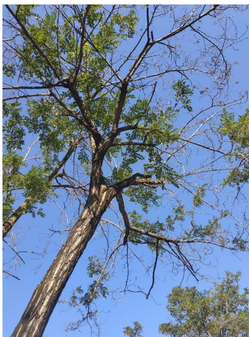
Alteraciones del ejemplar con id 43702