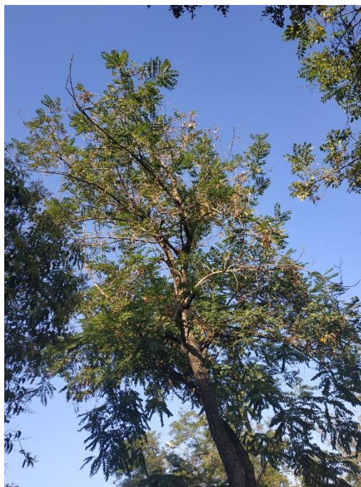
Ramas secas en el ejemplar con id 43705