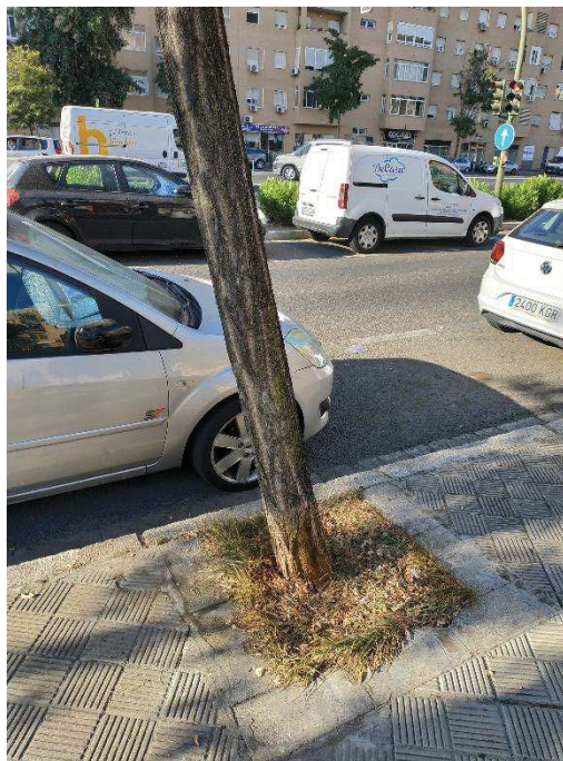
Vista general del ejemplar con id 43575