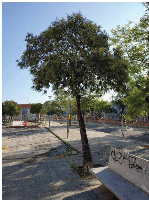
Vista general del ejemplar con id 43589