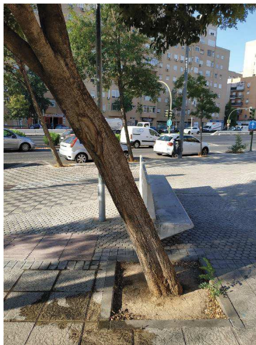
Vista general del ejemplar con id 43591