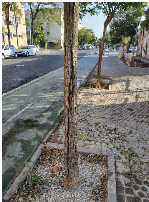
Ejemplar con id 43602