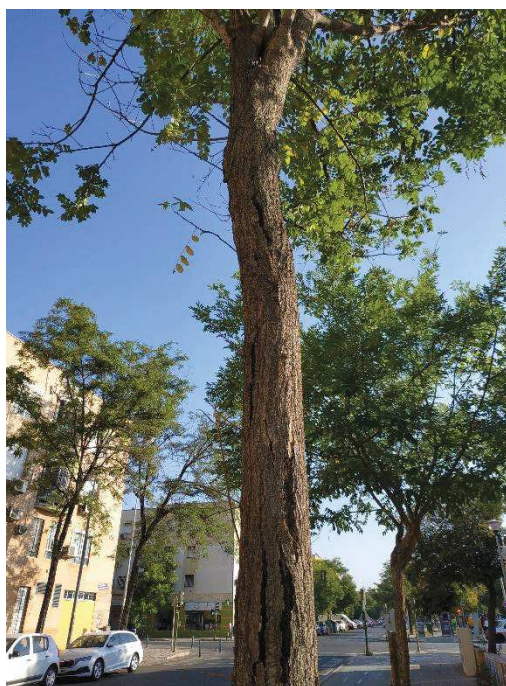
Ejemplar con id 43602