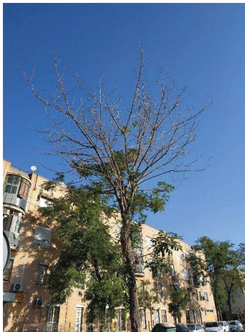
Vista general del ejemplar con id 43606