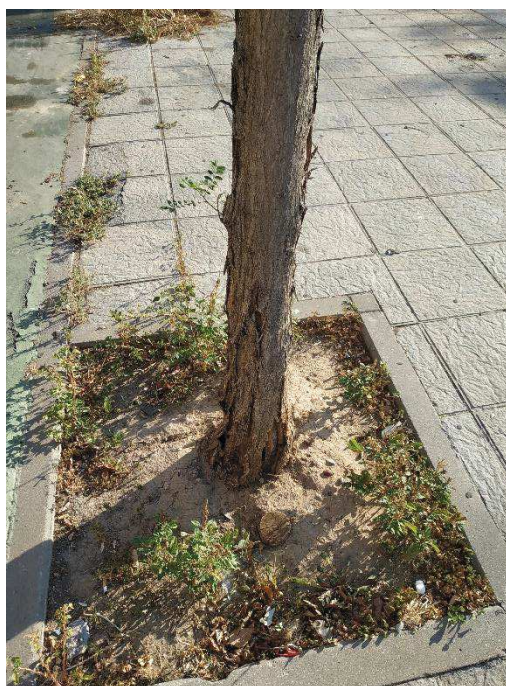
Alteraciones del ejemplar con id 43606