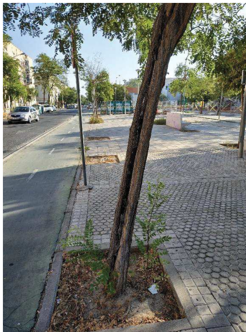
Imágenes del ejemplar con id 43610