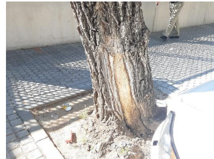
Inspección realizada en marzo de 2025