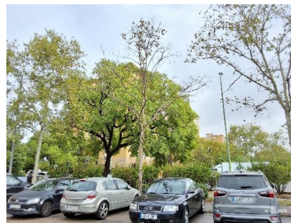
Imagen tomada durante la inspección (octubre 2025)

Calle Nicolás Alpérez s/n (Pabellón de la Telefónica de la Exposición de 1929) 41013 Sevilla Teléfono 95 54 73232