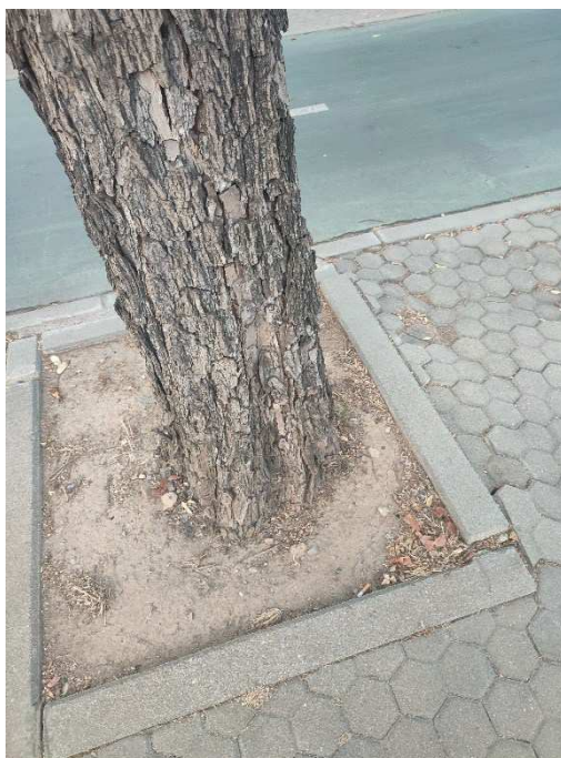
Imágenes del ejemplar con id 175