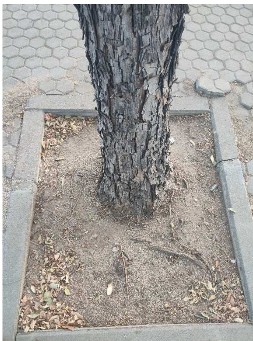
Imágenes del ejemplar con id 177