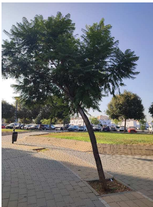
Imágenes del ejemplar con id 27685