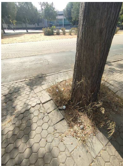
Imágenes del ejemplar con id 27672