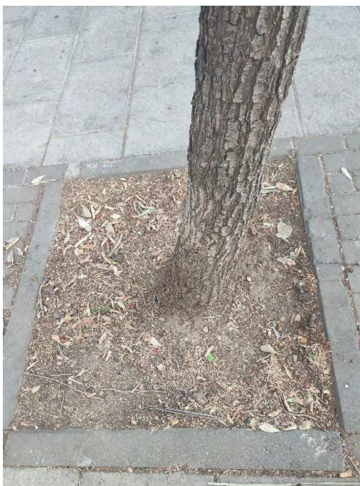
Imágenes del ejemplar con id 123056