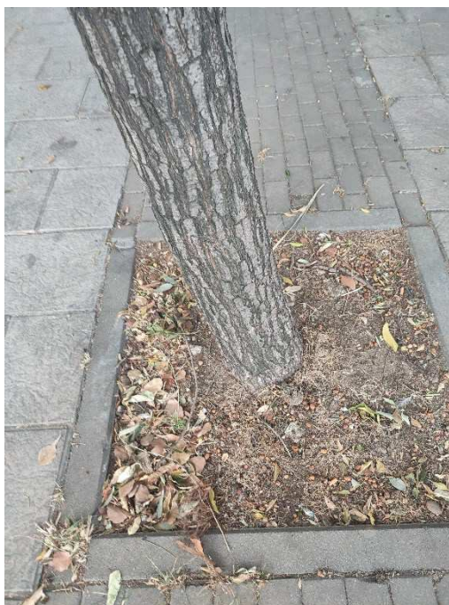
Imágenes del ejemplar con id 123059