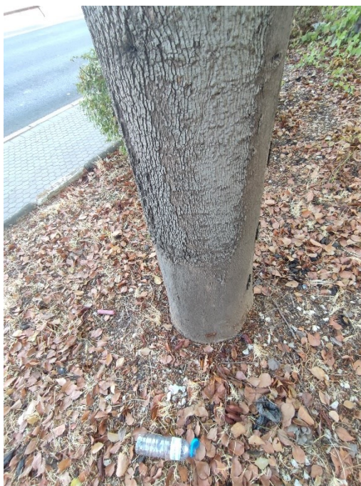
Imágenes del ejemplar con id 332