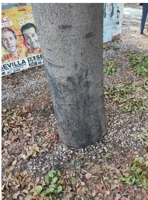
Imágenes del ejemplar con id 328