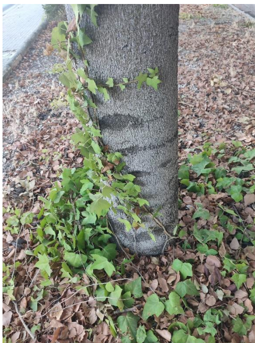
Imágenes del ejemplar con id 340