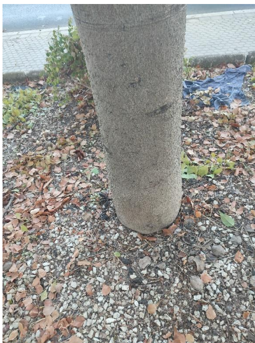
Imágenes del ejemplar con id 344