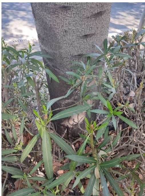
Imágenes del ejemplar con id 278