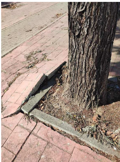
Imágenes del ejemplar con id 240