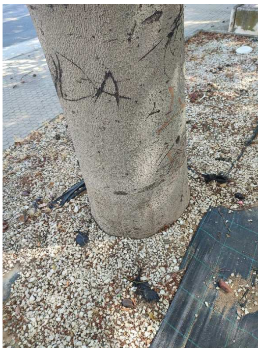
Imágenes del ejemplar con id 247