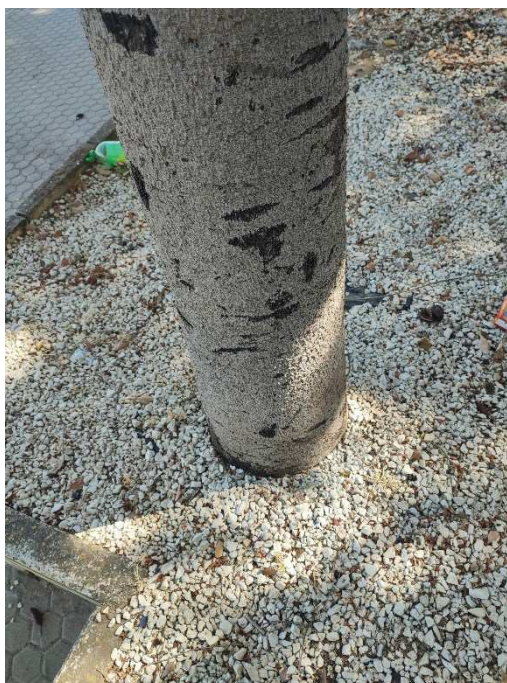
Imágenes del ejemplar con id 251