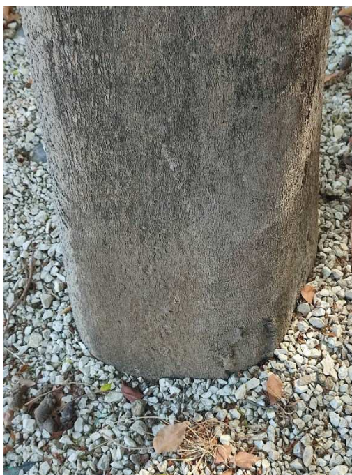
Imágenes del ejemplar con id 259