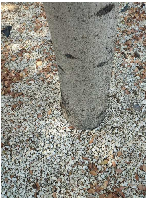
Imágenes del ejemplar con id 274