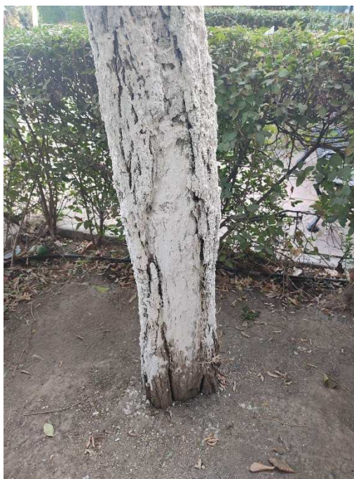
Imágenes del ejemplar con id 133254