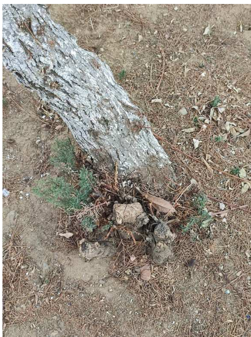
Imágenes del ejemplar con id 133262