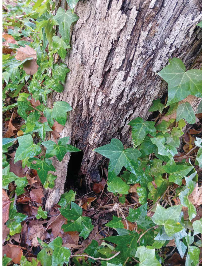
Detalle de la degradación en el cuello

Ayuntamiento de Sevilla Plaza Nueva, 1 41001 Sevilla +34 955 010 010 www.sevilla.org