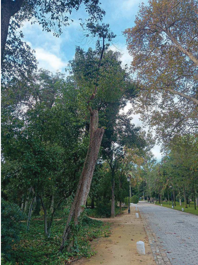
Vista general del ejemplar.