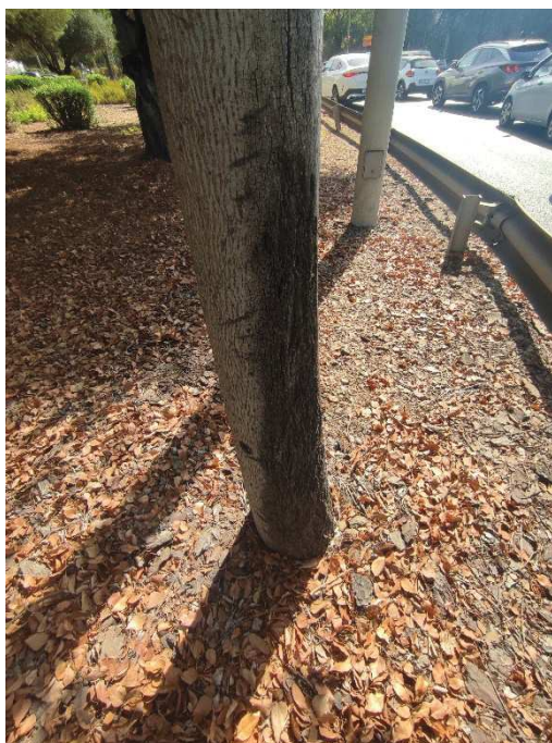
Imágenes del ejemplar con id 103978