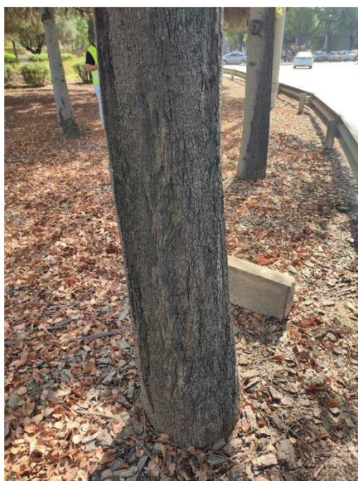
Imágenes del ejemplar con id 103976