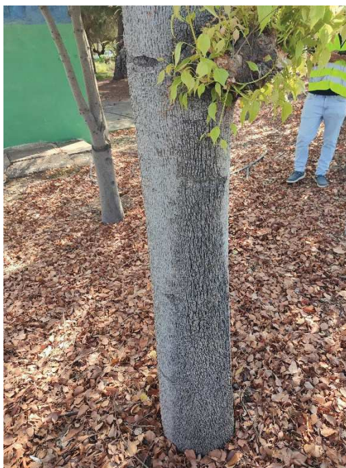
Imágenes del ejemplar con id 103973