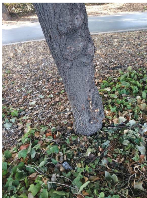
Imágenes del ejemplar con id 346