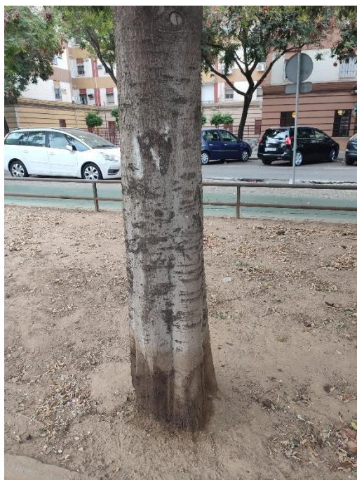
Imágenes del ejemplar con id 123207