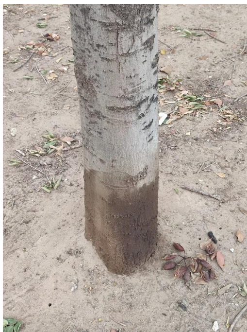
Imágenes del ejemplar con id 78