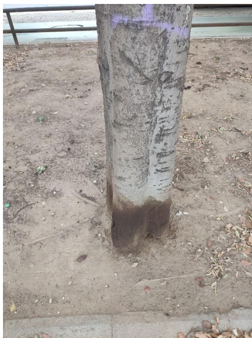
Imágenes del ejemplar con id 72