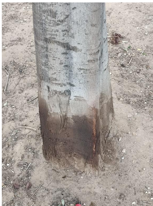
Imágenes del ejemplar con id 60