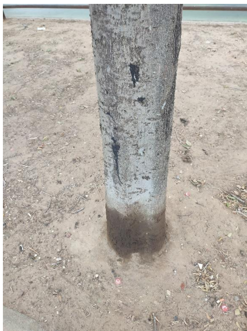
Imágenes del ejemplar con id 123132