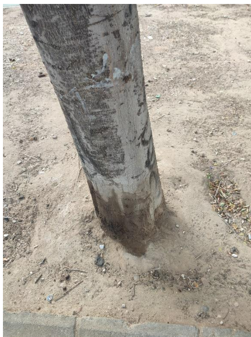
Imágenes del ejemplar con id 123194